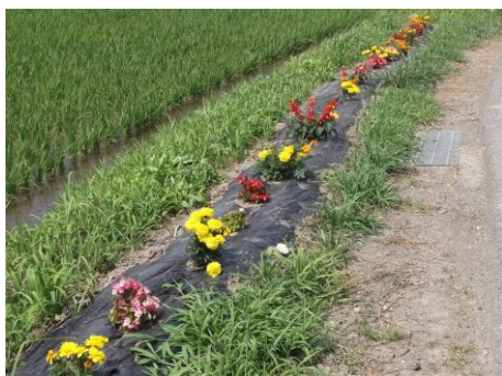
・小清水の道路脇