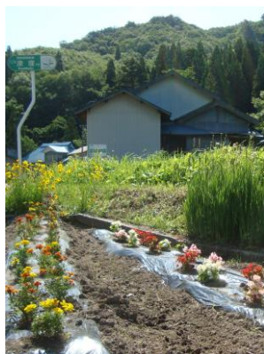
・水槽横の花壇(漆窪)