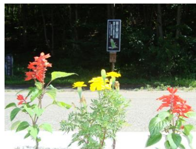
・富士山泥浮登山口