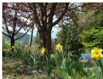
・去年植えた水仙が 見ごろに (5/2 泥浮)