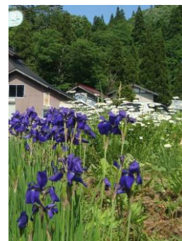
・あやめとマーガレットの 競演 (6/初漆窪)