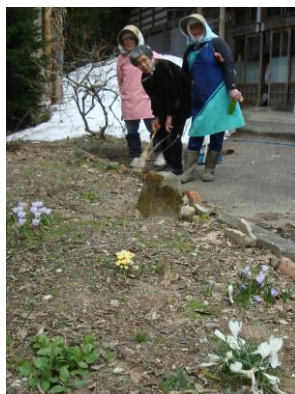
・雪融けあとにクロッカス (4/19 漆窪)