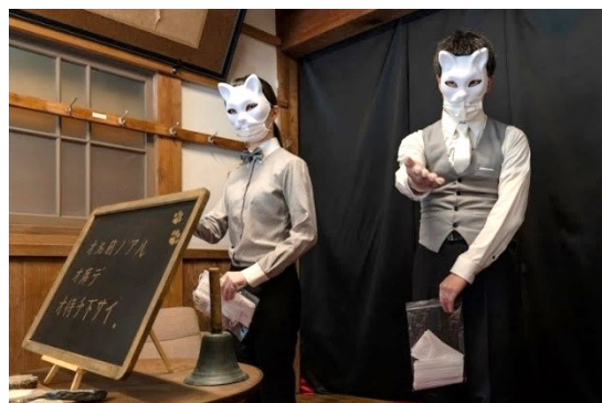
👉山猫より「マスクをきなさい」の注文が