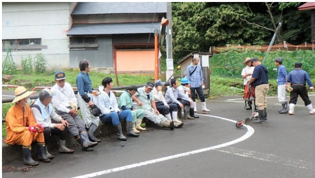
👉 草刈り班全員集合

7月5日(日)午前8時30分より正午まで、富士山関係の草刈りを行いました。天候は曇り空。漆窪から山頂までの参道はじめ、泥浮登山口、陳ヶ峯街道、陳ヶ峯陣跡の4班に分かれて作業し、その後は小清水集会所でバーベキューを堪能しました。今年、新型コロナウイルスの影響で山開きは中止となりましたが、登山客もちらほら来ています。3密にならない範囲でぜひ登ってみてください。