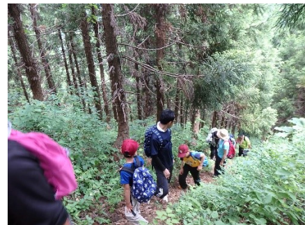
なんだ坂こんな坂、壱の坂