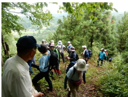
壺の坂より飯豊が遠くに望み