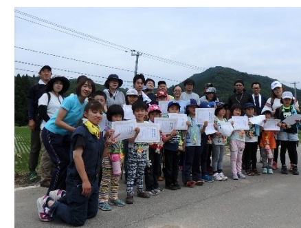
賞状をもらったよ!!