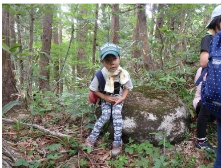
「お休み石」でちょっとひと休み