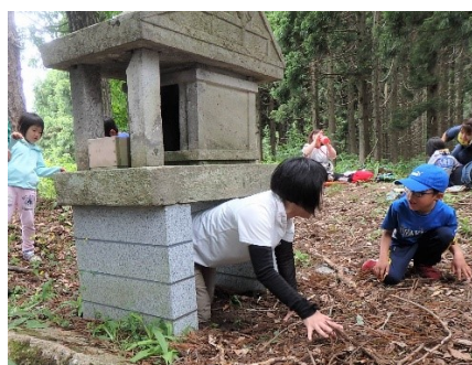
胎内くぐりで生まれ変わり