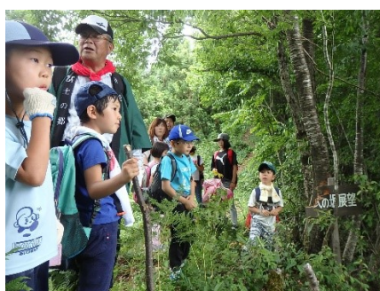
坂を登りきり、満足げ。