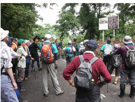
陣跡で戊辰戦争に思いをはせ