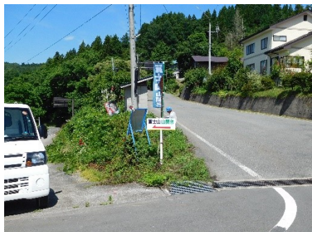
のぼり旗と案内板の設置 ↑大谷の交差点