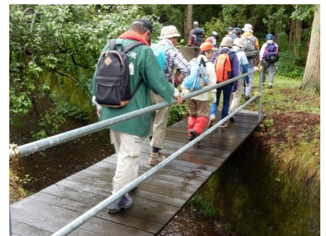
手すりの付いた木橋を渡り