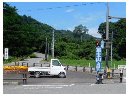
↑高郷中学校入口の十字路