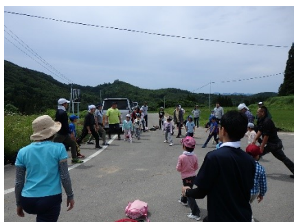
準備体操をしていざ出発！

頂上では胎内くぐりを楽しみ、立岩口に下りたところでクワゴを摘み、陳ヶ峯街道のむじな石の清水でのどを潤し、無事小清水に戻りました。そこで、保護者の皆さんから「登頂証明書」とお菓子のサプライズ！子供たちはとても嬉しそうでした。