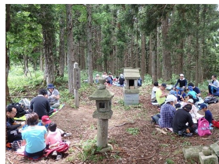
おにぎりがおいしい！