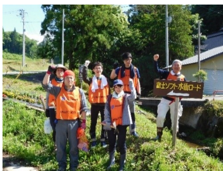
富士ソフトの皆さんには今年も活躍していただきました