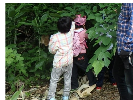
「クワゴ見いっけー！」