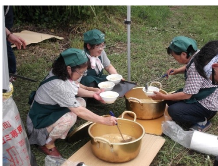
クジラ汁も大人気!