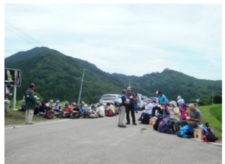
皆さんお疲れ様でした!