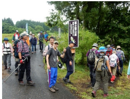
表参道(漆窪)登山口より入山