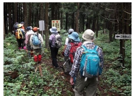
立岩口への分かれ道を下り