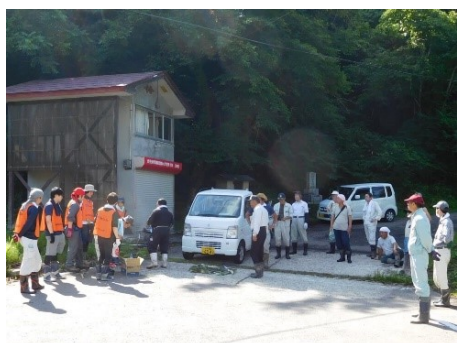
4班に分かれて作業実施

また、かねてより多くの方々から富士山山開きの参加者への道路案内がほしいとの要望があり、今年より案内板を準備し、10ヶ所程にのぼり旗と一緒に案内板を設置しました。