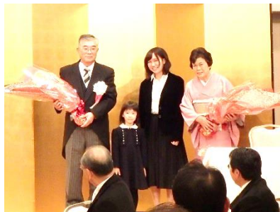
お孫さんより花束贈呈