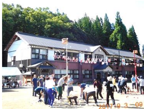
荒稼ぎ玉入れ合戦