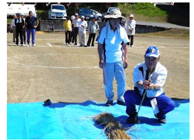
新郷独自の種目 縄ないリレー