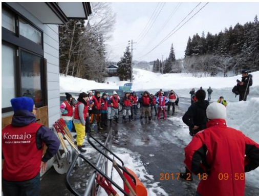
ウォーミングアップをして

2日目の2月19日(日)は集会所において、地元ばあちゃん2名の指導により、「ワラツット」の作り方から煮豆を入れてツットの縛り方までの納豆づくりを体験しました。納豆は温度をかけ2・3日で仕上がりますが、後日、名札の付けてあるそれぞれ自作品の納豆を送り届けました。食べたお味はきっと特別だったことと思います。