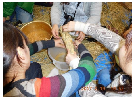
～ひろこアネエともこアネエに教わりながらワラツットを作って納豆づくり～