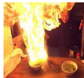
炎のネギラーメン