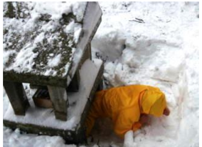
順番に胎内くぐり