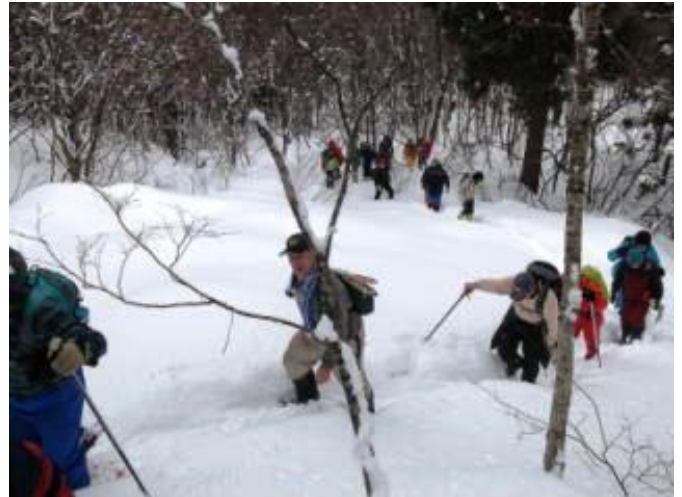
開会式の後、スノートレッキングコースへ