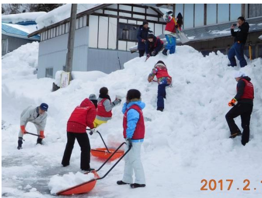
ジョセササイズのあとは