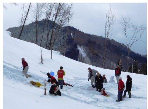
ソリ遊び！！ (後方は富士山)